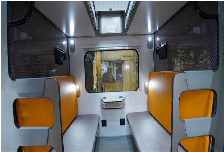
Comfortable cushioned berths