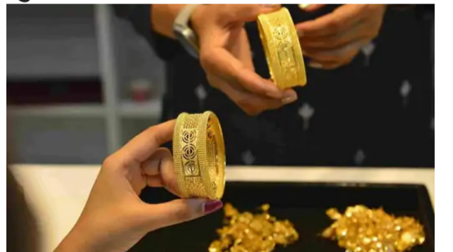
24 न्यूज अपडेट

आज सोना 538 बढ़कर 97,426 पर पहुंचा:3 दिन में ये 3,472 महंगा हुआ, चांदी 95,774 किलो बिक रही