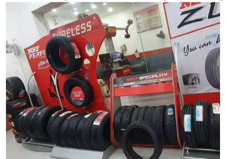
24 न्यूज अपडेट

MRF का चौथी-तिमाही में मुनाफा 29% बढ़कर 512 करोड़:रेवेन्यू 11% बढ़ा, 229 डिविडेंड देगी कंपनी; टॉय-बैलून बनाने से हुई थी शुरुआत