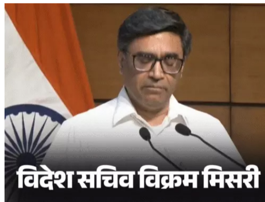
विदेश सचिव विक्रम मिसरी

पाकिस्तान में आतंकी ठिकानों पर एयर स्ट्राइक के करीब 9 घंटे बाद सरकार, सेना और एयरफोर्स के अफसरों ने घटना की जानकारी दी। बुधवार सुबह 10:30 बजे मीडिया ब्रीफिंग से पहले एयर स्ट्राइक का 2 मिनट का वीडियो प्ले किया गया। इसमें बताया गया कि मंगलवार रात 1:04 बजे से 1:11 बजे के बीच 7 मिनट में 9 टारगेट तबाह किए गए। हालांकि ऑपरेशन पूरा होने में कुल 25 मिनट का समय लगा।