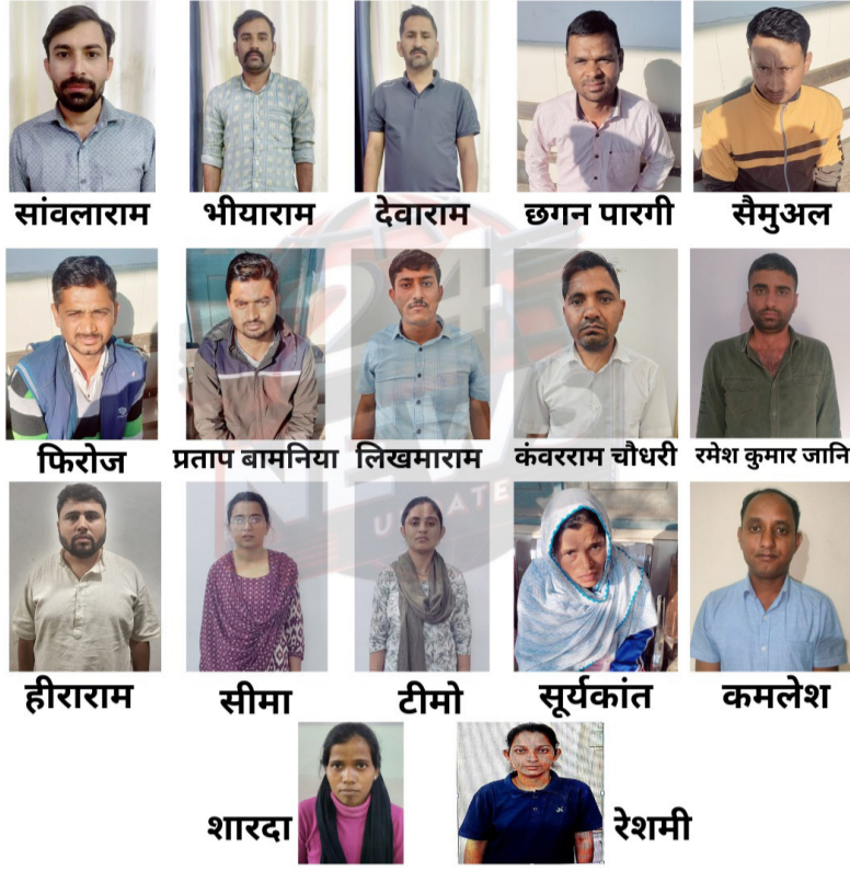
24 न्यूज अपडेट