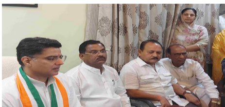
24 न्यूज अपडेट