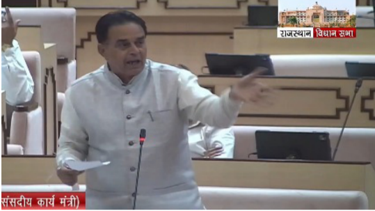
संसदीय कार्य मंत्री