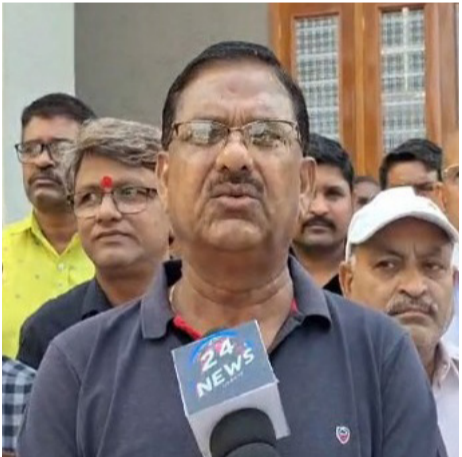
24 न्यूज अपडेट