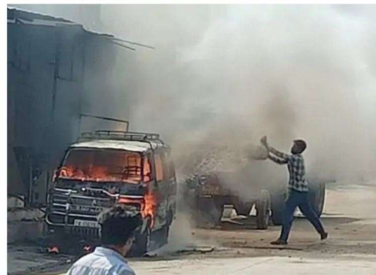
24 न्यूज अपडेट

भीलवाड़ा. बीच बाजार एक मारुति वैन में अचानक आग लग गई। वैन वैल्विंग मिस्त्री की दुकान के बाहर खड़ी थी। अचानक लगी आग से अफरा-तफरी हो गई। देखते ही देखते वैन आग के गोले में बदल गई। घटना