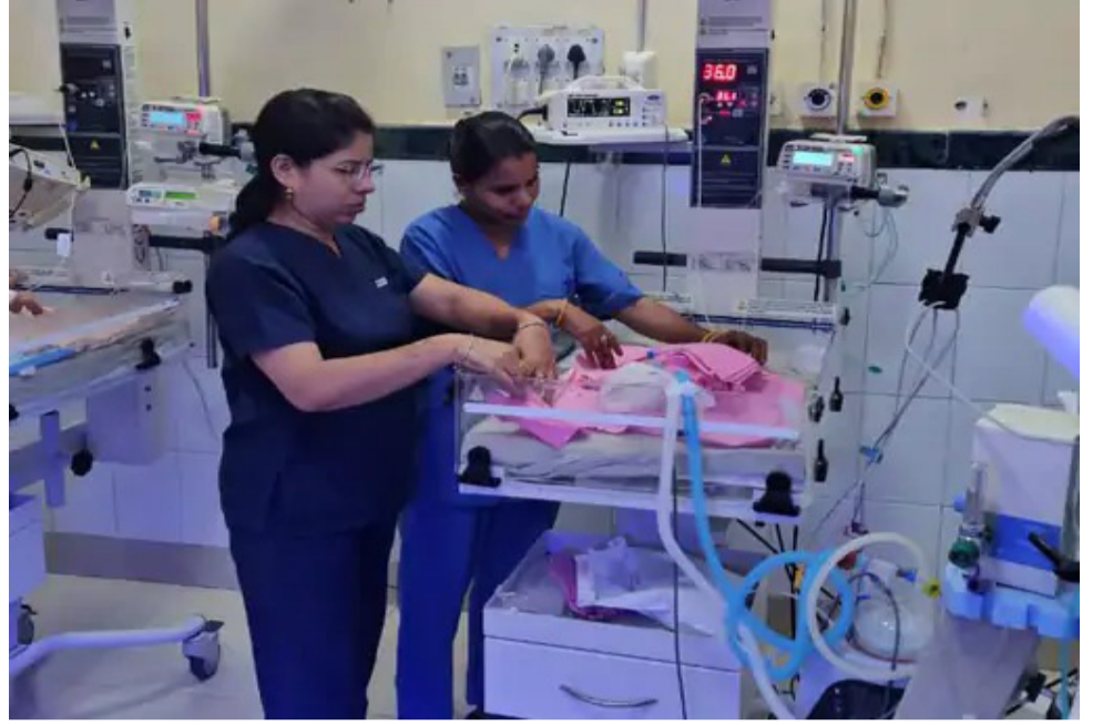
24 न्यूज अपडेट

भीलवाड़ा. बुधवार देर रात भीलवाड़ा महात्मा गांधी हॉस्पिटल के मातृ एवं शिशु इकाई के बाहर लगे पालना घर की घंटी बजी। हॉस्पिटलकर्मी जब बाहर पहुंचे तो उन्हें पालने में एक मासूम बच्ची मिली। इस बच्ची को तुरंत एनआईसीयू में एडमिट किया गया। जहां उसका इलाज किया जा रहा है। बच्ची की हालत इन्फेक्शन के चलते ठीक नहीं है। इसका इलाज किया जा रहा है।