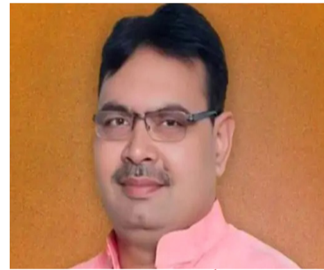
24 न्यूज अपडेट