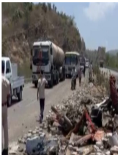
भाई-बहन और भतीजी की मौत हुई है तथा चौथा मरने वाला ट्रैलर का

24 न्यूज अपडेट. उदयपुर। मालवा का चौरा पर हुए हादसे में एक ही परिवार के 3 लोगों समेत 4 की मौत हो गई। मालवा चौराहे पर दोपहर 12.30 बजे एक ही परिवार के ये सभी लोग शादी का मुहूर्त निकलवाने जा रहे थे। तभी पीछे से ट्रैलर का ब्रेक फेल हो गया व आगे चल रहे डंपर को टक्कर मार दी। डंपर बेकाबू होकर डिवाइडर की दूसरी तरफ जाता हुआ सड़क किनारे चल रहे एक परिवार के 3 लोगों पर पलट गया। हादसे में