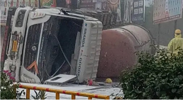
24 न्यूज अपडेट