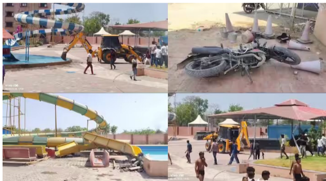
24 न्यूज अपडेट