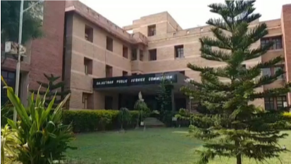
24 न्यूज अपडेट

अजमेर. राजस्थान लोक सेवा आयोग की ओर से सहायक आचार्य, पुस्तकालय अध्यक्ष और शारीरिक प्रशिक्षण अनुदेशक (कॉलेज शिक्षा विभाग) प्रतियोगी परीक्षा 2023 के 5 विषय की मॉडल उत्तर कुंजी जारी की गई है। इन विषयों में स्कल्पचर, पेंटिंग्स, म्यूजियोलॉजी, जैनेलॉजी और गारमेंट प्रोडक्शन एवं एक्सपोर्ट मैनेजमेंट की मॉडल उत्तर कुंजियां आयोग की वेबसाइट पर जारी कर दी गई हैं। यदि किसी अभ्यर्थी को इन मॉडल उत्तर कुंजियों पर कोई आपत्ति हो, तो निर्धारित शुल्क के साथ 12 से 14 जून को रात्रि 12 बजे तक अपनी आपत्ति