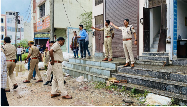
24 न्यूज अपडेट

तो हैरानी की बात है, क्योंकि इससे उनकी आजीविका पर सीधा असर पड़ेगा। पिछले दस वर्षों में बेशक पत्थरबाजी और आंदोलन वगैरह की घटनाएं कम हुई हैं, आतंकी हमलों में मरने वालों की संख्या भी घटी है, मगर हकीकत यही है कि दहशतगर्दी किसी भी रूप में कम नहीं हुई है। दस वर्ष पहले और बाद के आंकड़ों की तुलना से साफ पता चलता है कि आतंकी हमले बढ़े हैं। इस दौरान बेशक बड़ी तादाद में आतंकवादी मारे गए हैं, मगर दहशतगर्दी की भर्ती में भी तेजी आई है। उन्हें स्थानीय लोगों का समर्थन बढ़ा है। इसलिए यह स्वाभाविक ही पूछा जा रहा है कि जब सीमा पर चौकसी बढ़ी है, तलाशी अभियान तेज हुए हैं, दहशतगर्दी की वित्तीय मदद पर कड़ी निगरानी रखी जा रही है, तो उन्हें भर्तियां करने और साजो-सामान जुटाने में कामयाबी कैसे मिल जा रही है। पिछले दस वर्षों में जिस तरह सुरक्षाकर्मियों, सैलानियों, श्रद्धालुओं और बाहर से मजदूरी वगैरह करने गए लोगों को निशाना बना कर हत्याएं की गई हैं, उससे यह सवाल निरंतर गाढ़ा होता गया है कि आखिर यह सिलसिला कब रुकेगा। राष्ट्रीय जांच एजेंसी की रपट के मुताबिक ऐसे हमलों में पाकिस्तान के प्रशिक्षित दहशतगर्दी का हाथ होता है, स्थानीय लोग उन्हें सूचनाएं उपलब्ध कराते हैं। अगर सीमा पर चौकसी सख्त की गई है, तो फिर सीमा पार से आतंकियों की घाटी में पैठ कैसे हो पा रही है। अगर खुफिया तंत्र पहले से चौकन्ना हुआ है, तो आतंकी कैसे सेना के काफिले पर हमला कर देते हैं और पहले ही उसकी भनक नहीं लग पाती। घाटी में आतंकवाद से निपटने के लिए नए सिरे से रणनीति बनाने की जरूरत है।